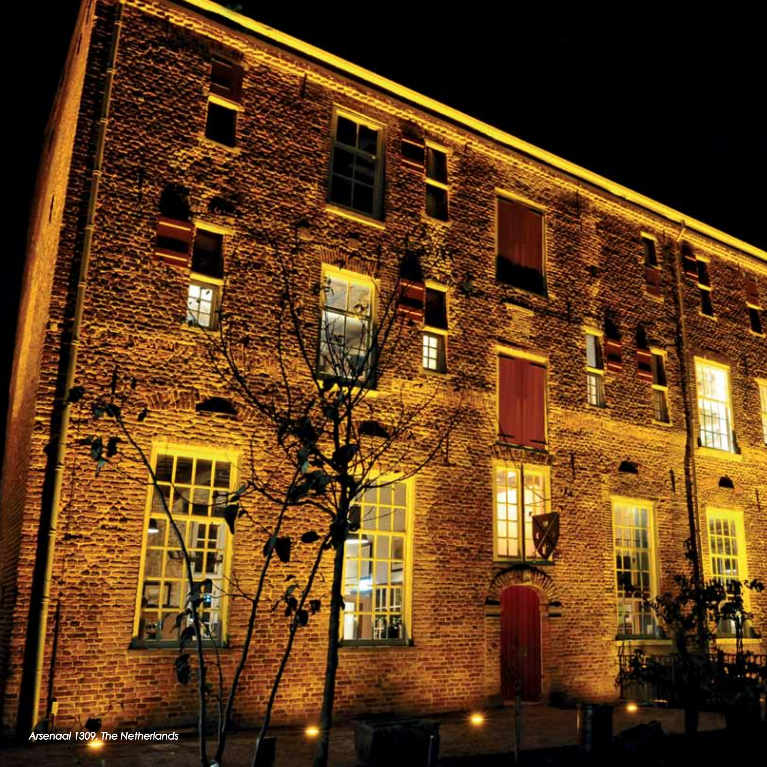
Arsenaal 1309, The Netherlands